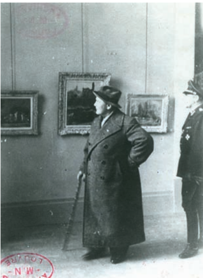
Hermann Goering

Les troupes allemandes entrent dans Paris le 14 juin 1940. Fermement décidée à se maintenir à son poste, Rose Valland ignore tout du plan imaginé de longue date par les nazis pour saisir les œuvres d'art des territoires occupés de l'Ouest : le Luxembourg, la Belgique, les Pays-Bas et bien sûr la France.