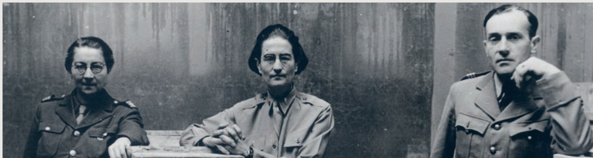
Rose Valland, Edith Standen et un officier, 1945