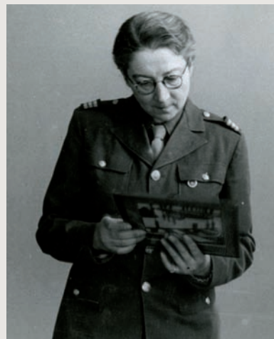
Rose Valland, capitaine Beaux-arts