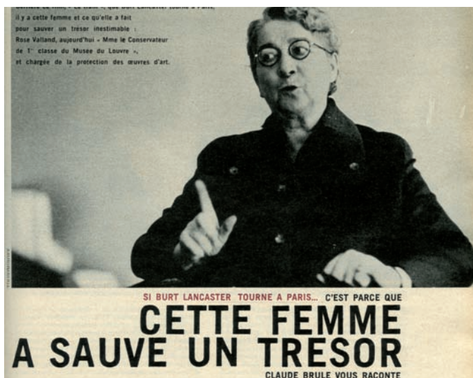
Magazine Elle du 6 septembre 1963 Coll. CHR D