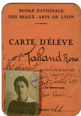
Carte d'élève de l'École nationale des Beaux-arts de Lyon, promotion 1922

L'enfance et les années d'apprentissage de Rose Valland ont pour cadre le village de Saint-Étienne-de-Saint-Geoirs (Isère), Grenoble et Lyon, où en élève travailleuse et décidée elle se forme à l'enseignement et aux Beaux-arts.