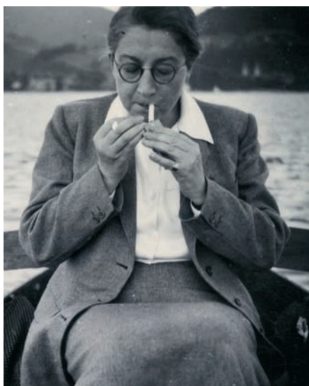
Rose Valland sur le lac de Constance

À la retraite à partir de 1968, Rose Valland continue inlassablement à travailler au classement du fonds d'archives de la Commission de récupération artistique, aujourd'hui improprement appelé « fonds Rose Valland ». En octobre 1979, elle fait don de ses archives personnelles à la Réunion des musées nationaux.