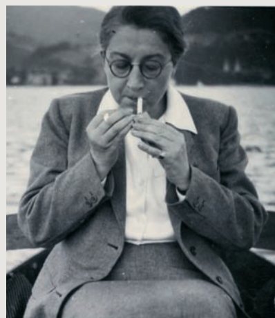
Rose Valland sur le lac de Constance