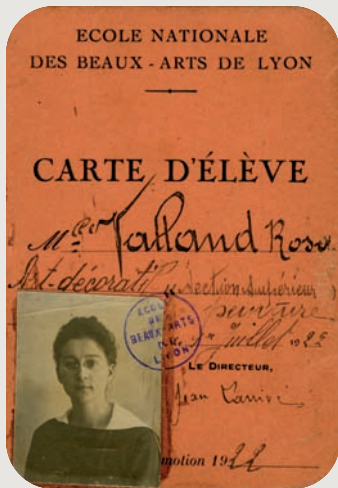
Carte d'élève de l'École nationale des Beaux-arts de Lyon, promotion 1922