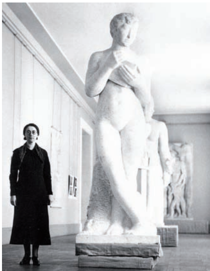
Rose Valland dans les salles du Jeu de Paume, vers 1934

Depuis le musée du Jeu de Paume, Rose Valland, comme des centaines d'hommes et de femmes, participe à cette entreprise.