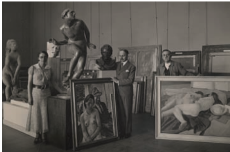
Rose Valland dans les salles du Jeu de Paume, vers 1934

En 1932, Rose Valland entre comme attachée bénévole au musée du Jeu de Paume. Situé aux avant-gardes de l'art contemporain, le musée multiplie les expositions et acquiert dans ces années trente, marquées par les initiatives du Front populaire, une notoriété certaine.