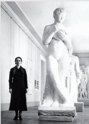
Rose Valland dans les salles du Jeu de Paume, vers 1934