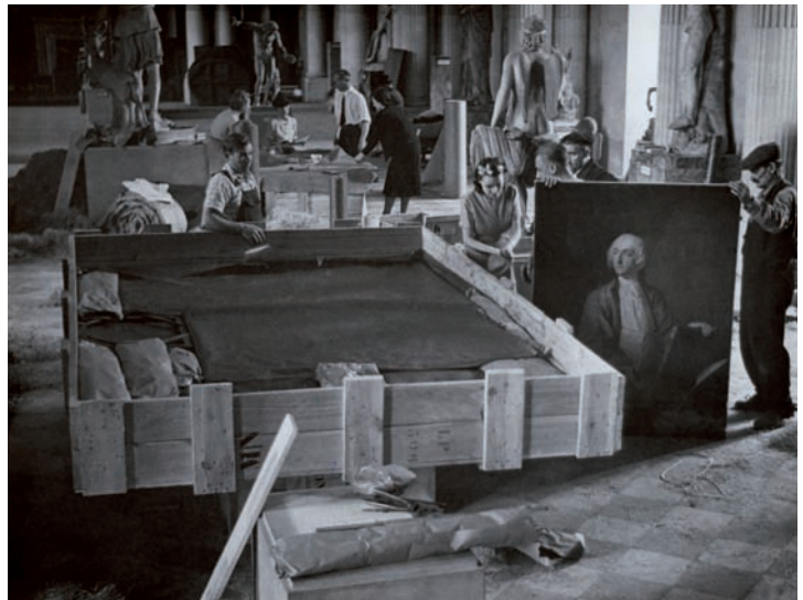
La mise en caisse des collections du Louvre, septembre 1939