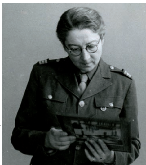
Rose Valland, capitaine Beaux-arts

Dès l'immédiat après-guerre, la recherche des œuvres d'art emportées en Allemagne est confiée à la Commission de récupération artistique (CRA), créée le 24 novembre 1944 sous l'impulsion du ministère de l'Éducation nationale. Sa mission consiste à étudier les problèmes liés à la récupération des objets et œuvres d'art et à recueillir, en étroite collaboration avec l'Office de la récupération des biens, les déclarations des propriétaires spoliés.