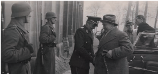
Hermann Goering en visite au musée du Jeu de Paume