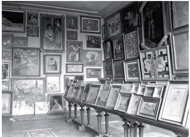
La salle des Martyrs du musée du Jeu de Paume

Dès sa prise de pouvoir en 1933, Adolf Hitler fait des arts un enjeu majeur de la politique national-socialiste. Soucieux d'imposer l'esthétique du III e Reich, il dénonce l'art moderne qualifié de « dégénéré » et expurge de sa présence les musées allemands. Les œuvres condamnées sont détruites, comme lors de l'autodafé berlinois du 20 mars 1939, ou vendues contre devises étrangères pour alimenter les caisses du Parti.