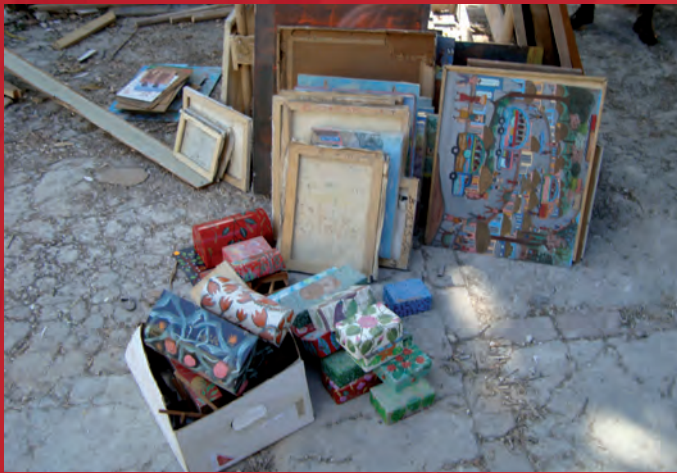
Le Centre d'Art à Port-au-Prince.

La Liste Rouge d'urgence des biens culturels haïtiens en péril est le premier volet du programme de l'ICOM pour la protection du patrimoine culturel de l'île d'Hispaniola. Elle sera suivie de la Liste Rouge des biens culturels en péril de l'île d'Hispaniola , qui décrira les catégories d'objets culturels particulièrement menacées en Haïti et en République dominicaine.